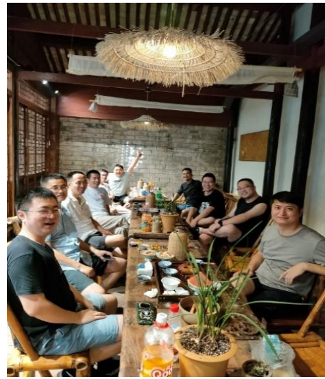
来自全国各地的游玩团队