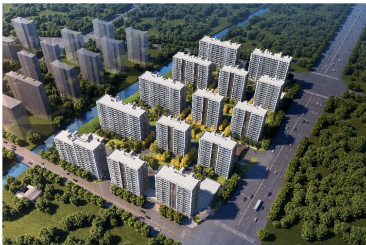
元禾村新村建设项目

元禾村新村建设项目位于应家自然村地块，建设用地 44044 平方米，总建筑面积 14.3 万平方米，其中地下 3.7 万平方米，地上 10.6 万平方米，容积率 2.4，绿地率 30%。由住宅，社区服务用房，配套商业用房及配套用房组成。其中住宅部分由 14 幢 14 层的小高层组成，建筑面积达 10 万平方米，城镇形象和人居环境品质大幅提升。