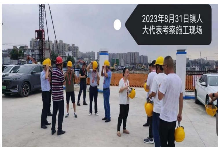
镇人大代表考察新村建设工地

依法办事、公开透明。通过公平、公正、公开，广泛征求村民群众意见，形成各项决策意见，经过村民代表大会通过后实施，并将有关内容一一上墙公布，做到政策全公开、工作全透明。按照“公开、公平、公正”的原则，做到一把尺子量到底，一个政策贯彻到底，实事求是，不搞边缘化、不搞特殊化，不让老实人吃亏，强化阳光拆迁，防止暗箱操作。