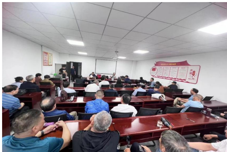
村民代表集体谋划新村建设

作推进的‘引擎’，推行“以易开局、以点带面，网格包干”的工作思路，通过支部发力、干部带头、党员包户的模式，按照先易后难原则，分梯队、分批次推进村民签约。通过建立问题清单、挂图作战、销号管理等办法，确保件件有落实，把最难的事办成最好的事。