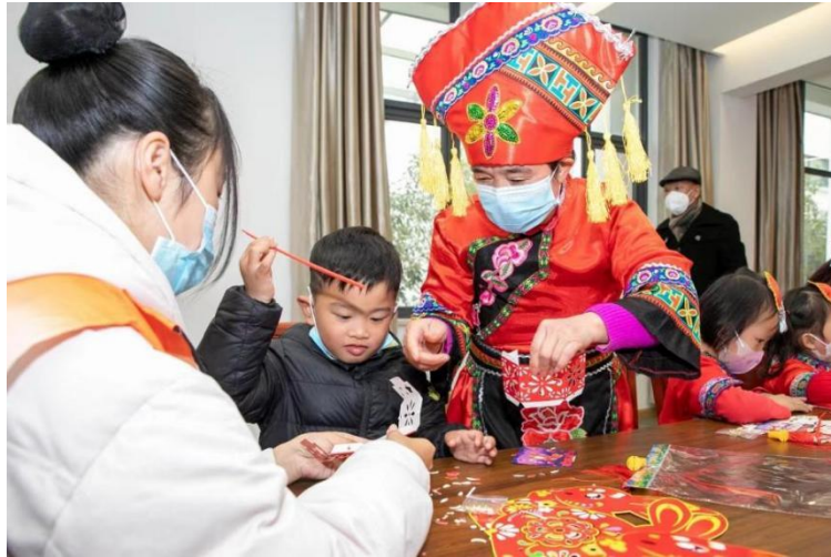
少数民族元宵节花灯活动