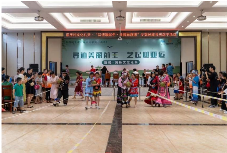
少数民族共庆端午活动

5. 提供助困服务。联系沟通企业和政府渠道，为困难少数民族群众提供帮扶。如少数民族困难群众救助、青少年助学帮困补助、节日慰问等，今年为 5 位困难少数民族群众提供政府救助渠道申请帮扶等。