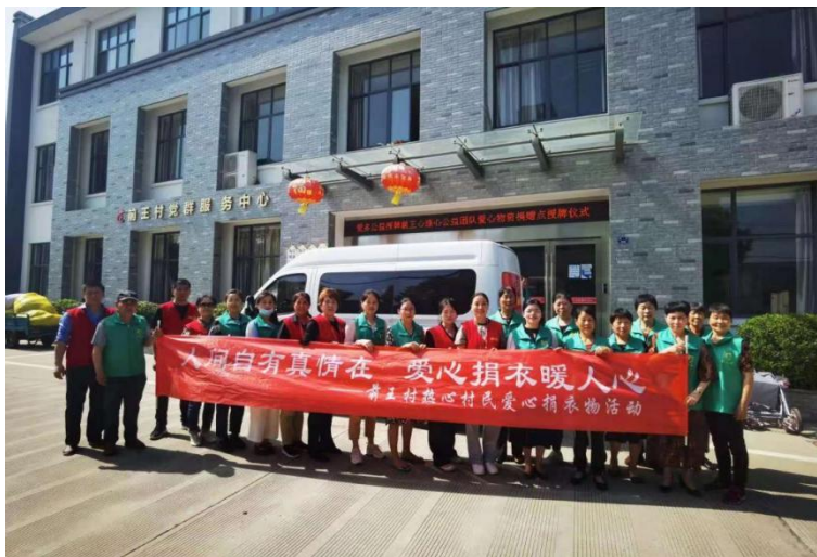
前王村志愿者服务团队活动

前王村新时代文明实践站地处海曙区洞桥镇的东南部，S214 省道南北贯穿，交通十分便利，村占地面积 1 平方公里，户籍人口 680 人，外来人口 600 余人，老年协会成员 300 余人。随着经济社会不断发展，越来越多的少数民族外来人员落户我村，逐渐变成新老宁波人的融合居住状态，如何让这些少数民族同胞有归属感，更好的在宁波工作生活，成了一个难题。针对这个情况，前王村新时代文明实践站，在区镇两级文明实践志愿团队结对入驻，并在其示范带动下，成立前王心连心公益团队，年均活动场次 30 余场，参与人次 2000 余人。团队成员 100 余人，其中注册志愿浙江人数 95 人，累计开展志愿服务 60 多次，培育了 8 个志愿服务项目：少数民族融入村社志愿服务、便民服务活动、民俗节日活动、医疗类志愿活动、环境保洁类志愿活动、“阳光助老”敬老爱老志愿服务，助力乡村振兴。