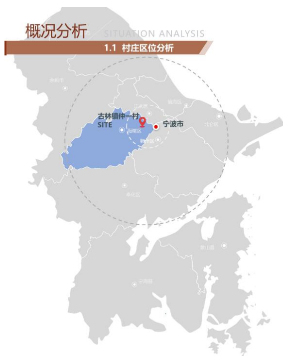
仲一村村庄所在地区

仲一村位于宁波市海曙区的西部，古林镇中部，南临甬金高速，西靠宁波市绕城高速，段梅公路穿村而过，交通便利。全村共有耕地面积 1526 亩，水稻、藜草等为主要作物，全村由 5 个自然点前中郑、后郑、仲一绿苑、石家桥、石马塘后虞组成。村内有四处文物古迹，石马塘自然村内的羊府庙、西侧有一座尚书桥、东侧有道家的青阳观。区域面积 1.83 平方公里，村内有 600 余户人家，是一个慢节奏生活的古村，我村工业发展不多，主要以农业为主，借由本次镇里大力支持蜃蛟农业片区农文旅发展。我村发展农旅从而带动村经济发展是现阶段来说比较适宜的方案。