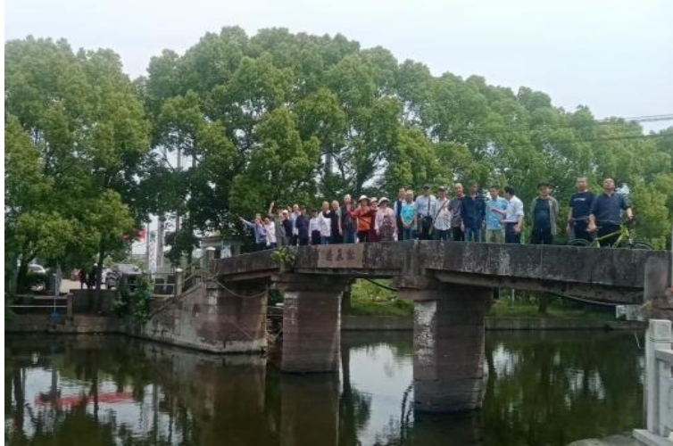
游客参观二桥一亭