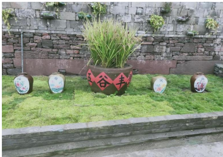
西杨村“美丽庭院”墙绘

近年来，我们先后组织发放“美丽庭院创建倡议书”、“房前屋后环境整理公告书”等宣传资料近 2000 余份，全村 80%的家庭参与到了创建活动，护绿巾帼志愿者小分队累计服务时长达到 800 余小时。可以说，美丽庭院创建工作的影响力在我村与日俱增。其中有一对夫妇是我们村里有名的“爱花人士”，平时就钟爱花草。自从我村美丽庭院建设发动后，在我们村妇联的宣传发动下，更积极投入到美丽庭院的建设中。在“草根”专家的指导下，夫妻俩主动规划庭院布置，自购花草百余盆，进去他们家的庭院宛如进入花的世界。该户女主人还是种花育花能手，作为我村的“美丽庭院”建设妇女骨干，她还经常会培育花苗分享给周边邻居，他们家还被评为了 2018 年度区级“美丽庭院”示范户。