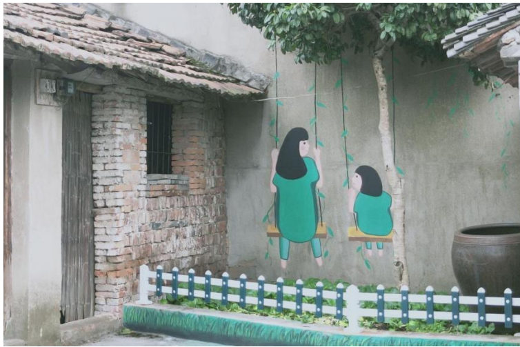
西杨村“美丽庭院”墙绘

经过一系列的清理整治，西杨村在 2018 年被评为海曙区美丽庭院示范村、海曙区乡村振兴精品村，工作成效获得上级领导的肯定。美丽庭院创建的成果也没有因为创建的结束而黯淡。如今村民自发性地打理着房前屋后的花草树木，不再随意堆放杂物，一同努力，保持居住环境的干净，美丽，让村民对美好生活的向往变成现实，目光所及之处皆是乡村的美丽画面。