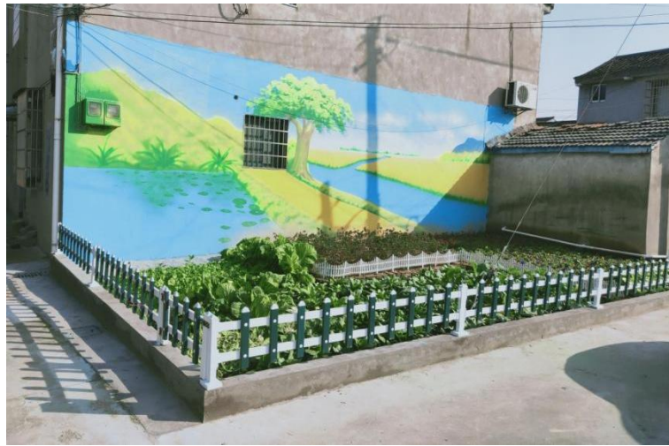
西杨村“美丽庭院”3D墙绘

现代农业种植，提高农田的利用率，并增加村民收入，实实在在地感受到美丽乡村带来的美好生活。